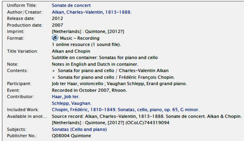
〈그림 5〉 스탠포드대학교 출력 사례