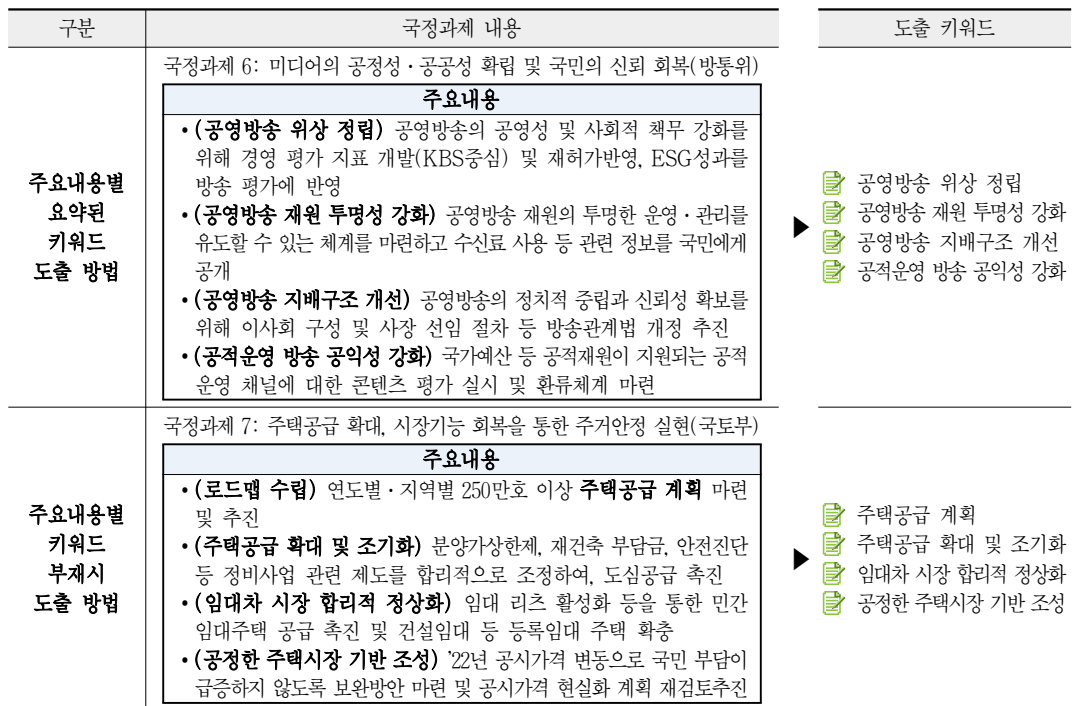
<표 10> 키워드 도출 방법

먼저, 주요 내용별로 요약된 키워드를 활용한 키워드 도출 방안이 있다. 예를 들어, 국정과제 6번의 미디어의 공정성/공공성 확립 및 국민의 신뢰 회복이라는 과제에서는 공영방송 위상 정립, 공영방송 재원 투명성 강화, 공영방송 지배 구조 개선, 공적운영 방송 공익성 강화를 요약하여 제시하였다. 따라서 해당 요약 단어(내용)를 기반으로 키워드를 도출할 수 있다. 다음으로는 국정과제의 주요 내용에 요약된 내용이 없거나, 제시된 키워드에 해당 국정과제의 수행 내용이 반영되어 있지 않다고 판단할 경우, 주요 내용 내의 추진하고자 하는 핵심 내용을 파악하여 키워드를 제시할 필요가 있다.